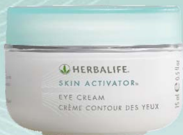
Crème Contour des Yeux