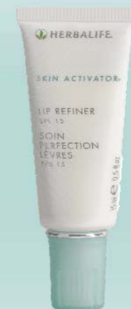
Soin Perfection Lèvres FPS 15