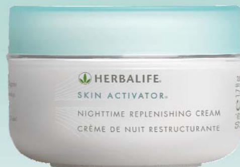
Crème de Nuit Restructurante