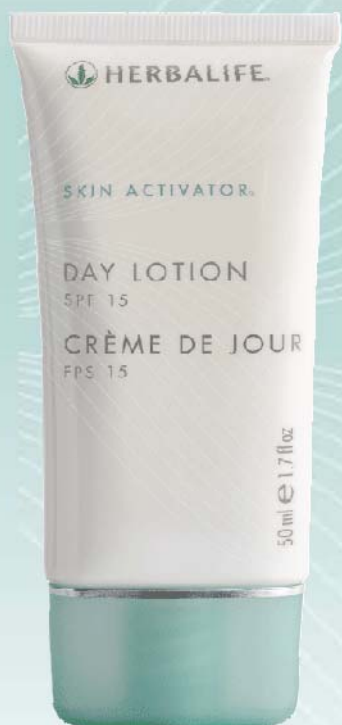
Crème de Jour FPS 15