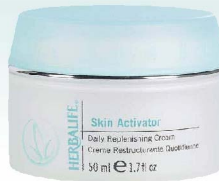
Crème Restructurante Quotidienne